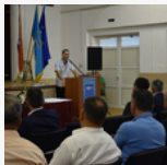
STRUČNI SKUP O RIBARSTVU

Agencija za ruralni razvoj Zadarske županije AGGRA, u okviru prioritetne osi 1 plave inovacije, kao partner sudjeluje u projektu INVESTFISH. Glavni je cilj jačanje konkurentnosti sustava proizvodnje i prodaje putem pilot aktivnosti kojima će se malim i srednjim poduzećima u ribarstvu i akvakulturi davati smjernice za inovacije te ih poticati na stvaranje inovativnih proizvoda i procesa kojima će se poboljšati njihov položaj na tržištu. Vrijednost projekta samo za ZŽ iznosi 174.240 eura.